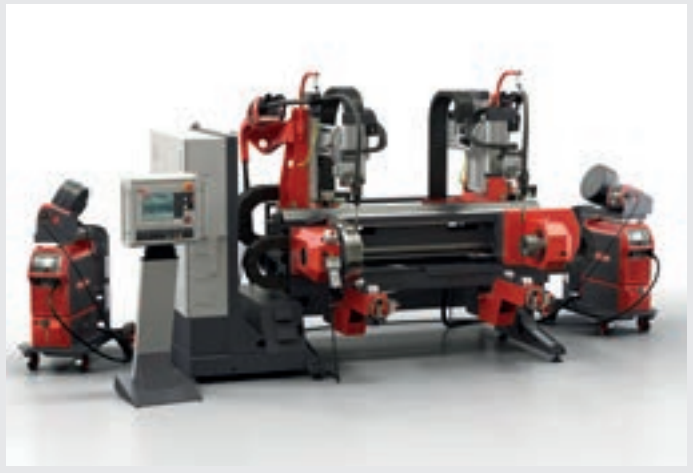
/ FCW Compact Dual (2 kaynak kafası ve takip ünitesi)

/ Perfect Welding / Solar Energy / Perfect Charging